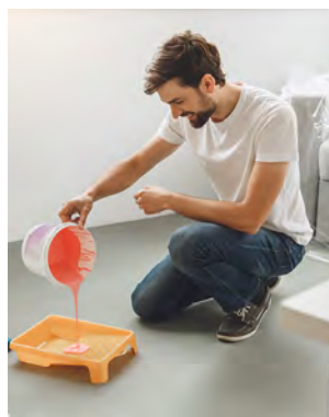
Farben: Häufig mit chemischen Schadstoffen und Schwermetallen belastet

wussten Konsum zu eliminieren und so die chronische Belastung mit heiklen Stoffen zu senken. Auf dem Land ist dies kaum möglich. Gegen Schadstoffe aus der Landwirtschaft sind Zäune machtlos.