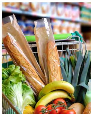
Lebensmittel: Tests des K-Tipp zeigen regelmässig Belastung mit Pestiziden

Die Unterschiede zwischen dem Mann aus der Stadt Fribourg und der Frau aus dem Kanton Thurgau zeigen: Der Wohnort hat einen grossen Einfluss auf die Schadstoffbelastung der Menschen. Städter haben eher die Möglichkeit, Schadstoffquellen über be-